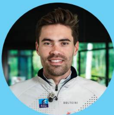
TOM DUMOULIN Ambassadeur

ROUTES | NIEUWS | KALENDER BIKEPARKS | HORECA | EVENTS